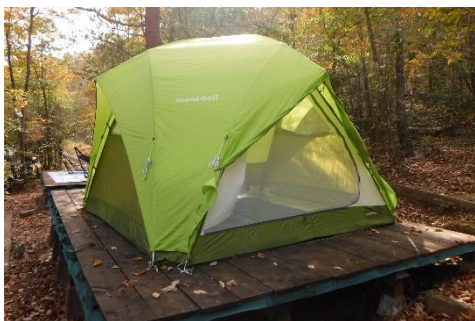
<4人用ドームテント>