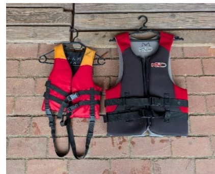
<ライフジャケット>