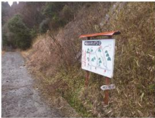
千ヶ畑口のバス停を少し進むと左手にコースマップがあり、そこが登山道入口です。